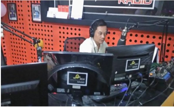
Kang Sarman Penyar Serang Radio bersiaran Program acara KSB