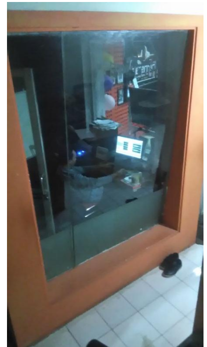
Program Director sedang editing ILM