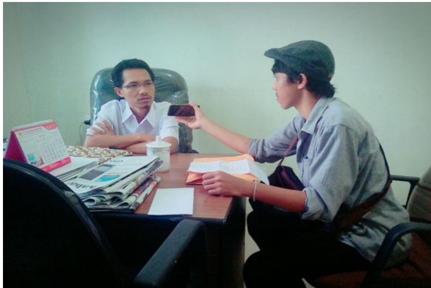
Dokumentasi bersama Komisi Informasi sebagai Pengiklan Serang