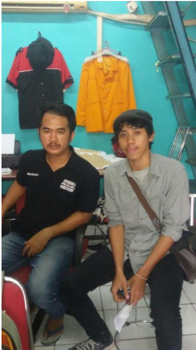
Dokumentasi peneliti dan pengiklan Swasta insert