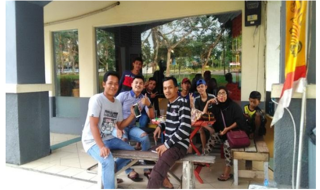
Balad SerangRadio sedang Berkumpul di Studio Serang Radio