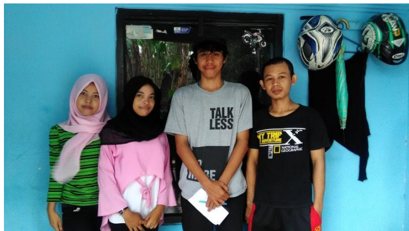
Dokumentasi bersama Pendengar Serang Radio Radio