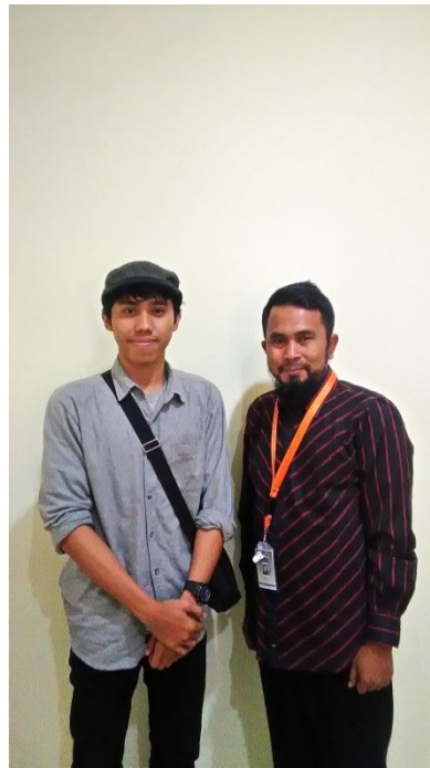
Dokumenasi Peneliti dengan General Manager Jaringan Etnikom