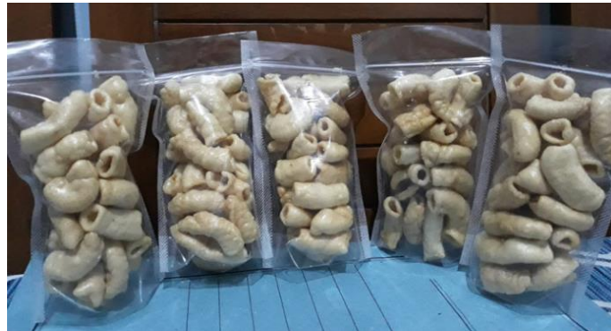
Gambar 4. Aneka kemasan Olahan Makanan Kader PKK dengan alat Sealer

alat sealer tersebut menjadikan bahan makanan yang dikemas menjadi lebih bagus dan rapih pada produk kemasan olahan pangan dari usaha kader PKK Kecamatan Jombang Kota Cilegon Banten seperti pada Gambar 4 berikut.