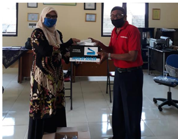
Gambar 3. Kerjasama Pengurus PKK dengan Posyantek Al-Ikhlas Pemanfaatan Alat Sealer

Dari gambar diatas menjelaskan tentang bagaimana kader PKK dapat menjalankan fungsinya sebagai organisasi di tingkat Kecamatan Jombang, pengurus dan anggota PKK dengan melakukan kemitraan. Salah satu bentuk kemitraan kader PKK disini adalah dengan keterlibatan lembaga terkait yang dapat menerapkan dan memanfaatkan teknologi tepat guna sederhana untuk menunjang kegiatan berwirausaha kader PKK di Kecamatan Jombang Kota Cilegon. Salah satu bentuk kemitraan antar-lembaga tersebut adalah dengan lembaga Posyantek (Pos Pelayanan Teknologi) Al-Ikhlas yang ada di Kecamatan Jombang Kota Cilegon Banten. Kemitraan yang dibina adalah dalam hal pemanfaatan alat teknologi berupa alat perekat kemasan produk makanan atau yang dikenal dengan sealer seperti pada Gambar 3 berikut.