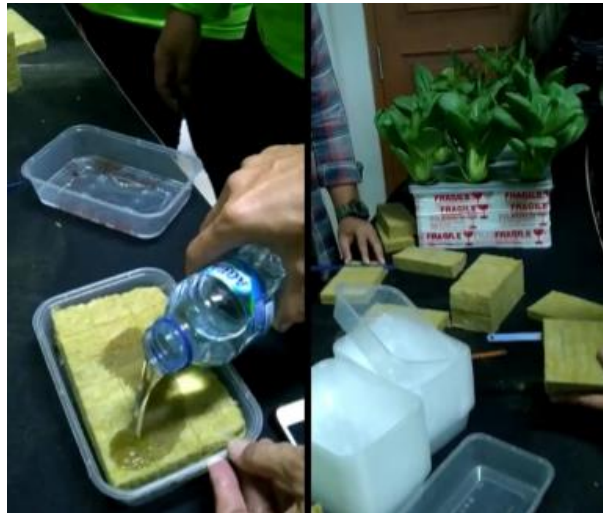
Gambar 6. Pelatihan Penerapan Membuat Tanaman Hidroponik bagi Kader dan Pengurus PKK Kecamatan Jombang Kota Cilegon Banten

terlihat dari kekompakan dalam melakukan praktek membuat tanaman sayur mayur hidroponik untuk pemenuhan kebutuhan rumah tangga dan juga untuk peningkatan pendapatan keluarga kader dan pengurus PKK Kecamatan Jombang Kota Cilegon Banten seperti pada Gambar 6 berikut.