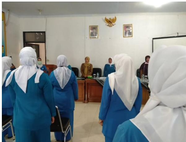
Gambar 8. Pembekalan Peningkatan Kompetensi Pengurus PKK di tingkat Kota Cilegon

Dengan melihat rangkaian kegiatan ini tentunya dapat diartikan bahwa PKK sangat berperan penting dalam peningkatan ekonomi masyarakat. Masyarakat yang bergabung dalam PKK diperkenalkan dengan berbagai kegiatan-kegiatan yang mampu meningkatkan keterampilannya dalam menciptakan lapangan pekerjaan, contohnya dalam bentuk pelatihan atau kegiatan sehingga mampu meningkatkan kreativitas, produktifitas dalam memenuhi kebutuhan kader PKK. Disamping PKK meningkatkan perekonomian masyarakat, PKK juga meningkatkan status lingkungan masyarakat. Peran PKK dalam peningkatan perekonomian masyarakat memang nyata adanya ini dikarenakan banyaknya kader PKK yang telah memiliki kemampuan untuk menciptakan usaha contohnya membuat olahan pangan dan kerajinan yang dapat meraup keuntungan kader dan keluarga kader PKK.