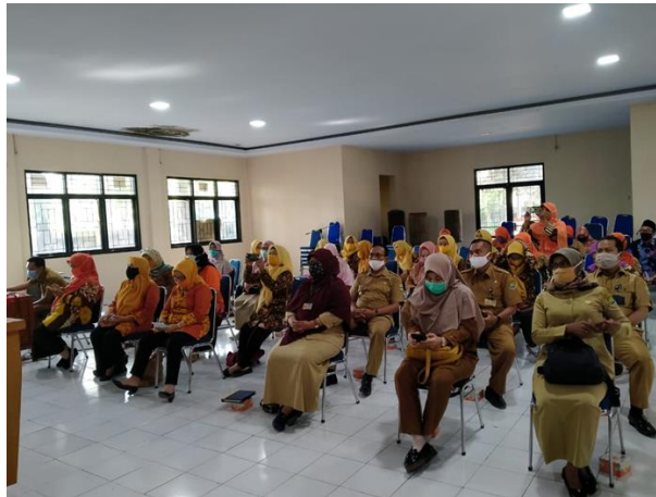
Gambar 7. Pembekalan Pengurus dan Kader PKK Kecamatan Jombang

Peranan PKK merupakan segala macam tindakan yang dilakukan melalui berbagai macam kegiatan keterampilan yang banyak dilakukan mulai dari hidup sehat, pendidikan keluarga yang dimulai dari lingkungan terbawah rumah tangga (RT), kelurahan, Kecamatan hingga tingkat Kota Cilegon. PKK bahkan bertugas untuk mensukseskan program pemerintah secara tegas menyebutkan bahwa PKK berperan dan bertujuan sebagai pembantu pemerintah dalam usaha pembangunan. Peranan PKK tersebut sejalan dengan visi dan misi PKK, dan didukung dengan sepuluh program pokok yang dimiliki PKK, kemudian lebih dikenal sebagai “Sepuluh Program Pokok PKK”. Kesepuluh program pokok tersebut adalah: (1) Penghayatan dan pengamalan Pancasila; (2) Gotong royong; (3) Pangan; (4) Sandang; (5) Perumahan dan tata laksana rumah tangga; (6) Pendidikan dan ketrampilan; (7) Kesehatan; (8) Pengembangan kehidupan koperasi; (9) Kelestarian lingkungan hidup; (10) Perencanaan sehat.