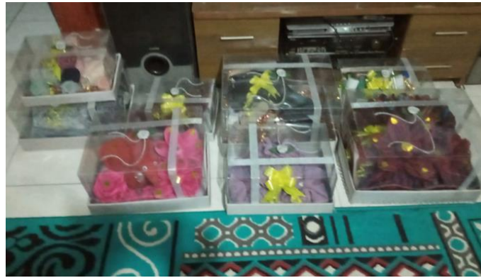
Gambar 5. Hasil Pelatihan Kader PKK Membuat Kerajinan Tangan Hantaran Nikahan

Dari hasil kreatifitas kader PKK tersebut selanjutnya dapat dipasarkan melalui kemitraan strategis antar instansi Pemerintah Kota Cilegon maupun dengan instansi swasta yang ada di Kota Cilegon. Produk bernilai tinggi dari kader PKK tersebut juga menjadi salah satu produk unggulan dalam setiap even di ajang Hari Ulang Tahun Kota Cilegon yang diselenggarakan oleh Pemerintah Kota Cilegon disetiap tahunnya. Dari kreatifitas kader PKK tersebut secara tidak langsung membrikan dampak yang sangat positif terhadap peningkatan pemenuhan kebutuhan ekonomi kader dalam keluarganya masing-masing.