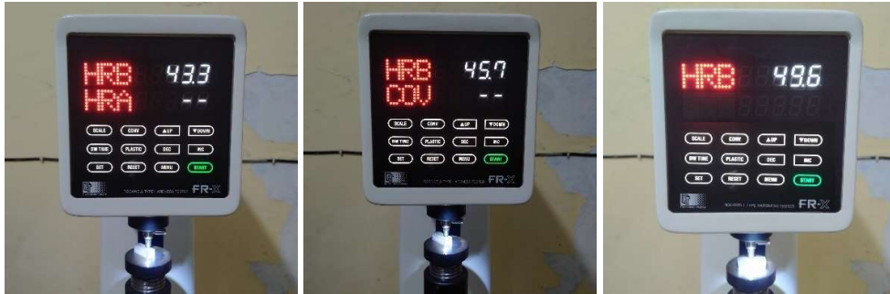
Hasil Uji Kekerasan Sampel Reduksi Ketebalan 2%