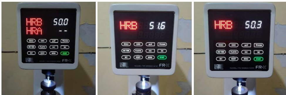
Hasil Uji Kekerasan Sampel Reduksi 4%