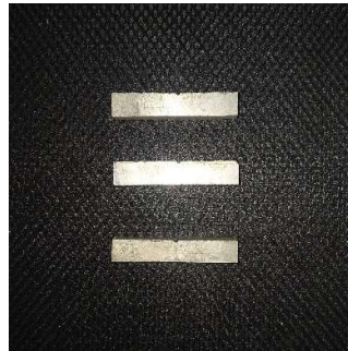
Uji Impak Sampel Reduksi Ketebalan 2%