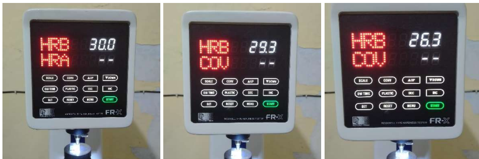
Hasil Uji Kekerasan Sampel Reduksi 5%