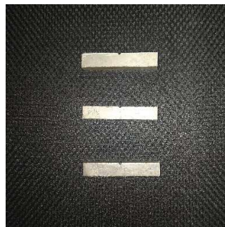
Uji Impak Sampel Reduksi Ketebalan 4%