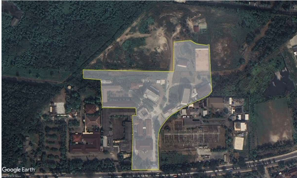
Gambar 4. 1 Lokasi Penelitian

Penelitian ini dilaksanakan di Lingkungan Fakultas Teknik Fakultas, Universitas Sultan Ageng Tirtayasa.