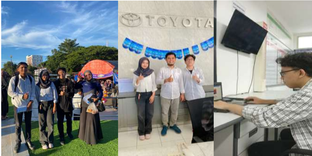
FOTO DOKUMENTASI OBSERVASI