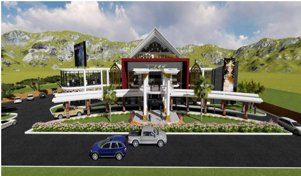
Gambar 4.1 Gambar Tampak Depan Gedung Wanita Kab. Manokwari