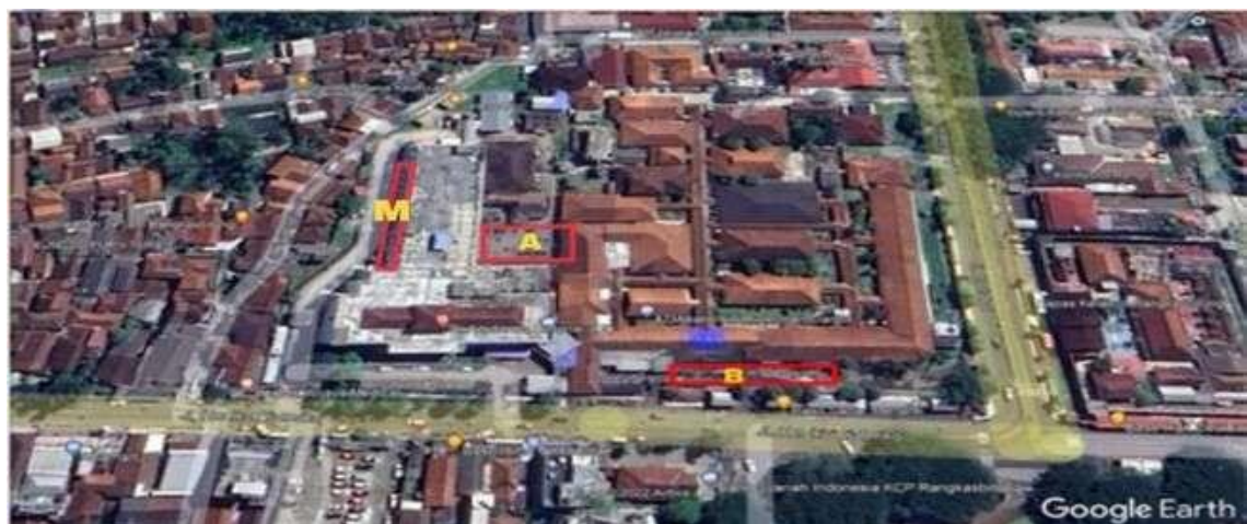
Gambar 4.3 Peta Lokasi RSUD DR.ADJIDARMO