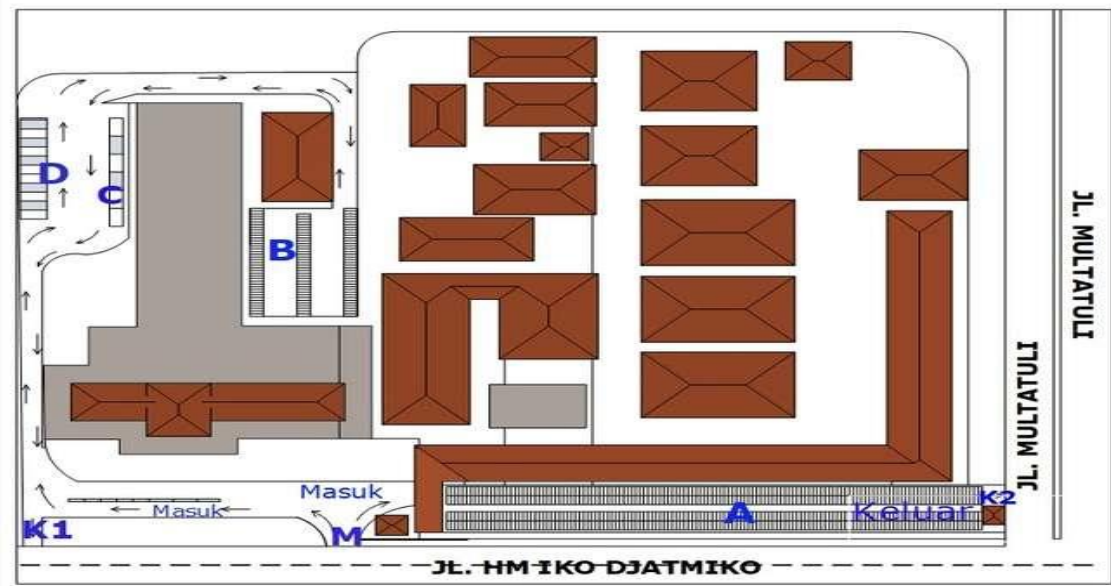
Gambar 4.4 Masterplan Kondisi Eksisting Area Parkir RSUD DR.ADJIDARMO