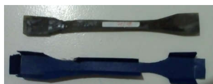
Gambar 5. Cetakan Material Komposit