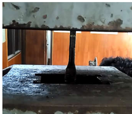
Gambar 7. Proses uji tarik material komposit karet

Hasil pengujian Tarik dengan mesin uji tarik UTM untuk produk komposit dengan komposisi paduan/persentase volume resin dan tanah lempung atau pasir 85/15, 65/35 didapatkan gaya dan tegangan tarik seperti ditunjukkan oleh Tabel 1. Besarnya gaya Tarik untuk material komposit karet dengan komposisi 85/15 adalah 150 Kgf dan tegangan tariknya 2,5 \text{ Kgf/mm}^2 . Sementara untuk material komposit sawit dengan persentase 85/15 memiliki gaya Tarik 30 Kgf dan tegangan 0,5 \text{ Kgf/mm}^2 . Pada komposisi sawit dengan persentase 65/35 memiliki gaya Tarik lebih tinggi yaitu 110 Kgf dan tegangan 1,83 \text{ Kgf/mm}^2 .