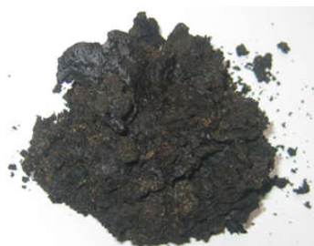
(a) Produk Limbah Sawit

Pengolahan limbah cair sawit dan karet dilakukan dengan menggunakan 40 liter limbah sawit dan karet. Temperatur pengeringan yang digunakan adalah 110^{\circ}\text{C} dengan waktu pengeringan 30-50 menit. Hasil pengolahan limbah sawit dan karet menjadi tanah lempung dan pasir dapat dilihat pada gambar 4. Pada gambar 4 terlihat bentuk limbah sawit berupa tanah agak padat sementara limbah karet menjadi pasir dengan masih ada kandungan elastisnya. Selanjut tanah lempung dan pasir ini akan dibuat produk komposit menggunakan resin dan katalis. Sebelum pembuatan produk komposit dibuat terlebih dahulu cetakan untuk pembuatan benda uji dari plastik tebal 1mm seperti pada gambar 5. Produk jadi specimen uji material komposit dapat dilihat pada gambar 6. Setelah specimen uji Tarik dibuat dilakukan finishing untuk meratakan permukaan specimen dan dilanjutkan dengan pengujian Tarik menggunakan mesin uji Tarik UTM. Proses uji Tarik specimen komposit menggunakan mesin uji Tarik UTM dapat dilihat pada gambar 7.