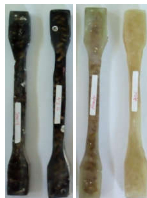
Gambar 6. Material Komposit