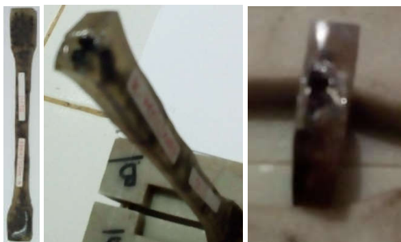
Gambar 9. Bentuk patahan komposit sawit dengan komposisi 65/35