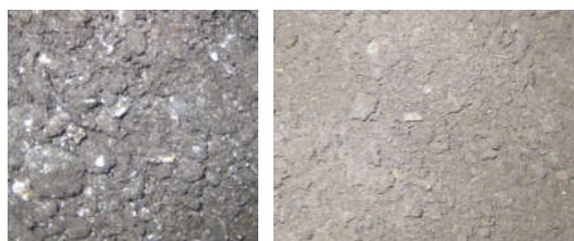
(b) Produk Limbah Karet