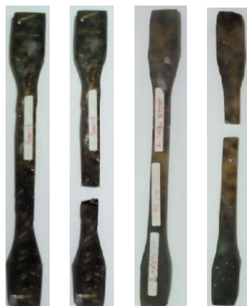
Gambar 8. Bentuk patahan material komposit