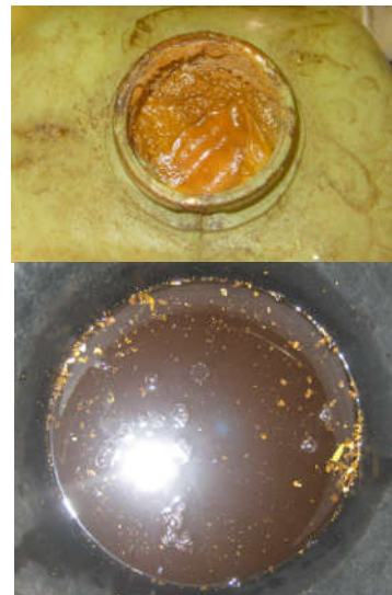
Gambar 3. Limbah cair sawit dan karet

Urutan proses pembuatan spesimen komposit adalah: