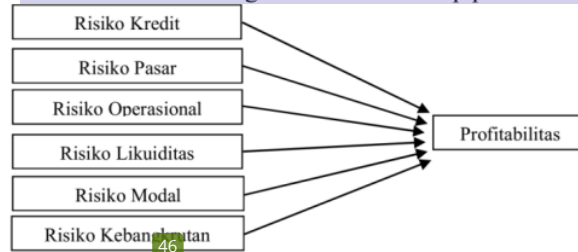
Gambar 1 Model Penelitian

Sedangkan Model Penelitian Pengaruh risiko terhadap profitabilitas sebagai berikut: