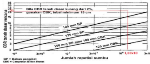
Gambar 2. Tebal Pondasi Bawah