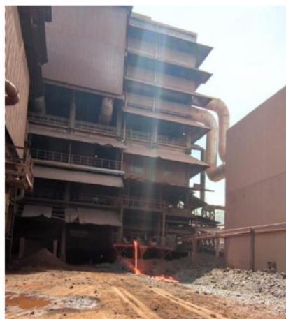
Gambar 1. Pengolahan Slag Nikel

Limbah slag terbentuk melalui proses peleburan bijih nikel adalah: slag cair dengan temperatur kisaran \pm 1550^{\circ}\text{C} langsung dikeluarkan melewati slag runner ke kolam granulasi ( slag granulation pond ) kemudian slag cair yang mengalir akan mengalami pendinginan. Metode pendinginan pada pengolahan slag terdapat 2 proses dimana dibantu dengan semprotan air dengan tekanan tinggi untuk memecah ukuran slag sehingga terbentuk granule (butiran-butiran) dan pendinginan dengan udara, dimana ukuran butir agregat limbah slag nikel bisa diatur dengan alat pemecah batu ( stone crusher ), berikut pada gambar 1 proses pengolahan slag.