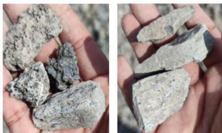
Gambar 2. Slag Nikel