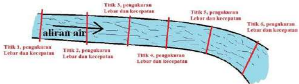
Gambar 2. Area/Titik Pengukuran Saluran

Sedangkan peralatan pendukung yang digunakan untuk mengambil data, yaitu Kamera (Olympus Stylus Tough 6000D 10 Megapixels), Alat Tulis, Current Meter , dan Roll meter .